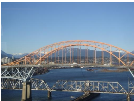
L'un des ponts pour aller de Surrey à Burnaby