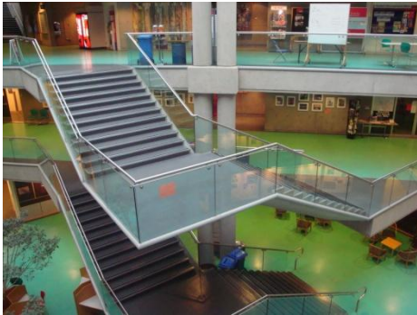
Le centre administratif du site de SFU Burnaby