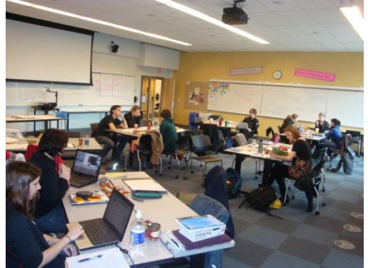
Salle de cours à SFU

Utilisez cet atout pour partager avec eux, pour leur demander aussi comment ils expliquent telle ou telle notion grammaticale en français (car ils sont les représentants des jeunes apprenants que vous aurez dans vos classes, donc ils ont intériorisé le français en tant qu'apprenant de seconde langue.