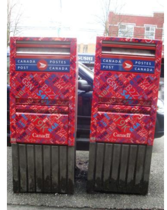
Boîtes aux lettres