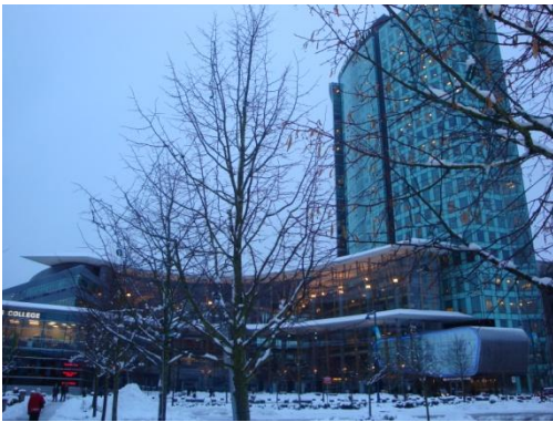
Site de SFU Surrey, station de Skytrain : Surrey central station

La certification Duale, c'est l'occasion de pouvoir allier la théorie à la pratique de deux mondes différents : la théorie du système français avec le pragmatisme du système anglophone. La certification n'est pas de tout repos, puisqu'elle demande 200% de l'attention de ses membres, notamment à trois périodes : en début d'année de Master 2, il faut être capable de rentrer tout de suite dans l'optique de travailler à 150% dès la première semaine du M2. Ensuite, la deuxième phase est pendant les vacances de Noël : il faut penser à tout en terme administratif pour le Canada et au niveau des dossiers en cours pour la France alors que l'on est déjà, psychologiquement au Canada et en train de penser aux "problèmes" Canadiens. Ensuite après 5 semaines de relâche, cela permet à SFU de nous trouver notre école d'accueil pour le premier stage « Observation/Enseignement ». Votre lieu d'affectation (école/lycée) est déterminé par votre lieu d'habitation à Vancouver.